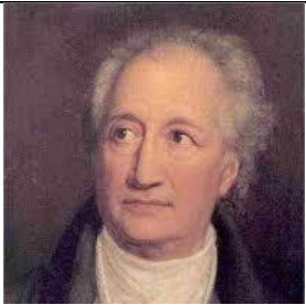
Johann Wolfgang von Goethe

Warum sind diese Leute bekannt ? Mach Notizen auf Deutsch!