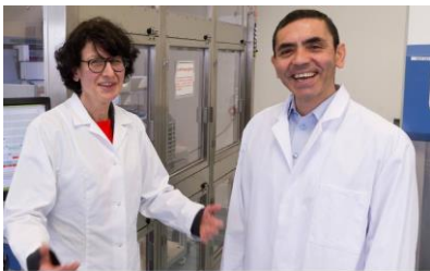
Özlem Türeci und Ugur Sahin